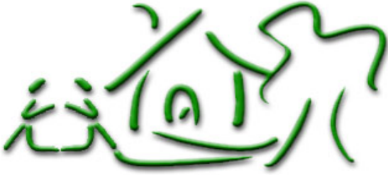
Selbstversorgung und Produktion innerhalb des Ubuntu Estland Projektes

Aus der Finanzierung mit Eigenmitteln und durch Investoren und viel gemeinsamer, motivierter Arbeit entsteht innerhalb des UBUNTU Estland Projektes aber nicht nur Raum zum Wohnen und Urlaub Machen: Sondern auch eine teilweise Unabhängigkeit von Supermarkt, Kühlkette und Lebensmitteln, die unter nicht nachvollziehbaren Bedingungen produziert werden.